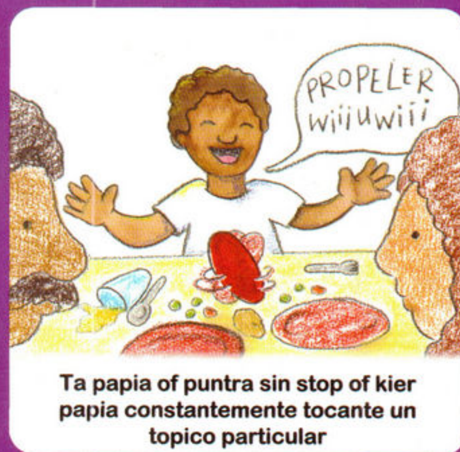
Ta papia of puntra sin stop of kier papia constantemente tocante un topico particular